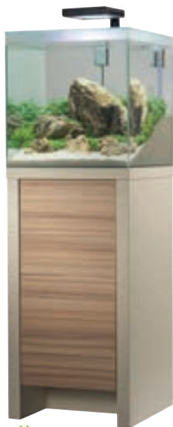
Hagen, Aquafresh 60 litres

L'aquarium doit être considéré comme la reconstitution d'un milieu naturel. Le fond de la cuve s'apparente donc au sol que l'on peut rencontrer au fond d'une rivière. Dans le contexte de l'aquarium, le sol aura une épaisseur comprise entre 4 et 10 cm. La partie la plus épaisse (de 7 à 10 cm) se situera vers l'arrière où s'installent les plus grandes plantes. Pour des raisons esthétiques, ne dépassez pas 5 cm au premier plan.