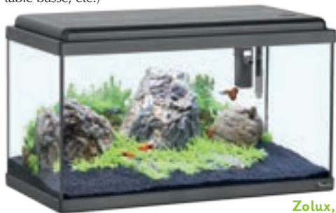
Zolux, Aquarium LED 60 litres

Si vous encastrez l'aquarium, optez pour une cuve nue aux parois collées. Les bacs qui seront posés sur un support gagnent à s'habiller de cornières. Il existe aussi des ensembles qui intègrent la cuve dans un meuble (bar, table basse, etc.)