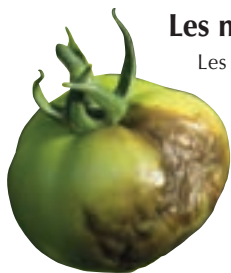
Apparition de mildiou