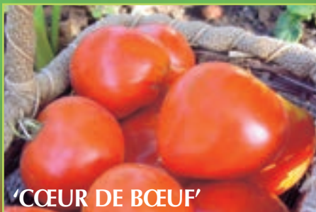
'CŒUR DE BŒUF'

Variété de mi-saison. Elle produit des fruits de belle taille (150 à 200 g) d'un rouge très foncé (d'où son nom). Sa chair est juteuse, douce légèrement sucrée. Elle est délicieuse!