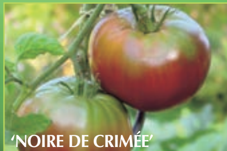
'NOIRE DE CRIMÉE'

('Cornue des Andes', 'Chinèse'). Les nombreuses hybridations ont entraîné une multitude de formes intermédiaires et il est parfois difficile de s'y retrouver. L'essentiel étant néanmoins le goût qu'elles laissent en bouche! La saveur des tomates diffère beaucoup en fonction de la variété, mais aussi de son mode de culture. Ainsi une variété goûteuse comme 'Cœur de bœuf' aura une saveur quelconque si on la cultive sous serre à grand renfort d'engrais et d'arrosage. Pour être goûteuse, une tomate a besoin de soleil, d'une terre fraîche et surtout très riche pour qu'elle se développe harmonieusement. C'est d'ailleurs pour cela qu'une tomate cultivée de manière traditionnelle aura toujours « plus de goût ».